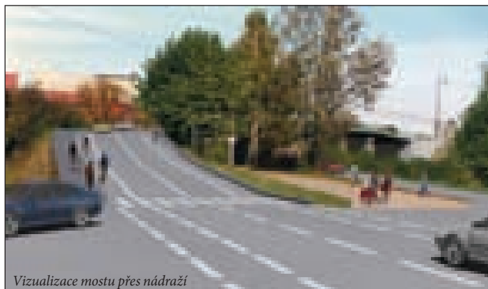
Vizualizace mostu přes nádraží

Intenzita dopravy a způsob provozování mostu budou regulovány dopravním značením (např. 6 t mimo MHD a dopravní obsluhu), v krajním případě i fyzickými zábrany (např. sklápěcí sloupky).