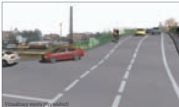
Vizualizace mostu přes nádraží

Naopak současná víceletá nefunkčnost mostu pro automobilovou dopravu se spolupodílí na dopravních problémech jinde ve městě, přičemž Blanické předměstí a Kou-