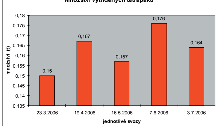
Množství vytríděných tetrapaků