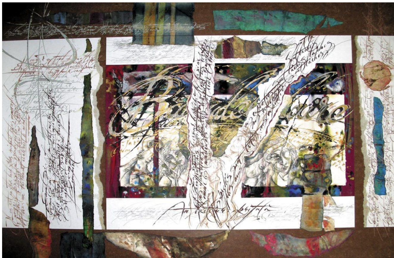
ALEXANDRU MACOVEI OMAPIN CHARLES BAUDELAIRE