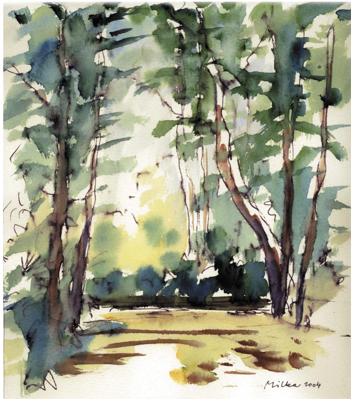
EDUARD MILKA CHVĚNÍ - TREMOR