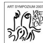
INGE - ROSE LIPPOK Deutschland