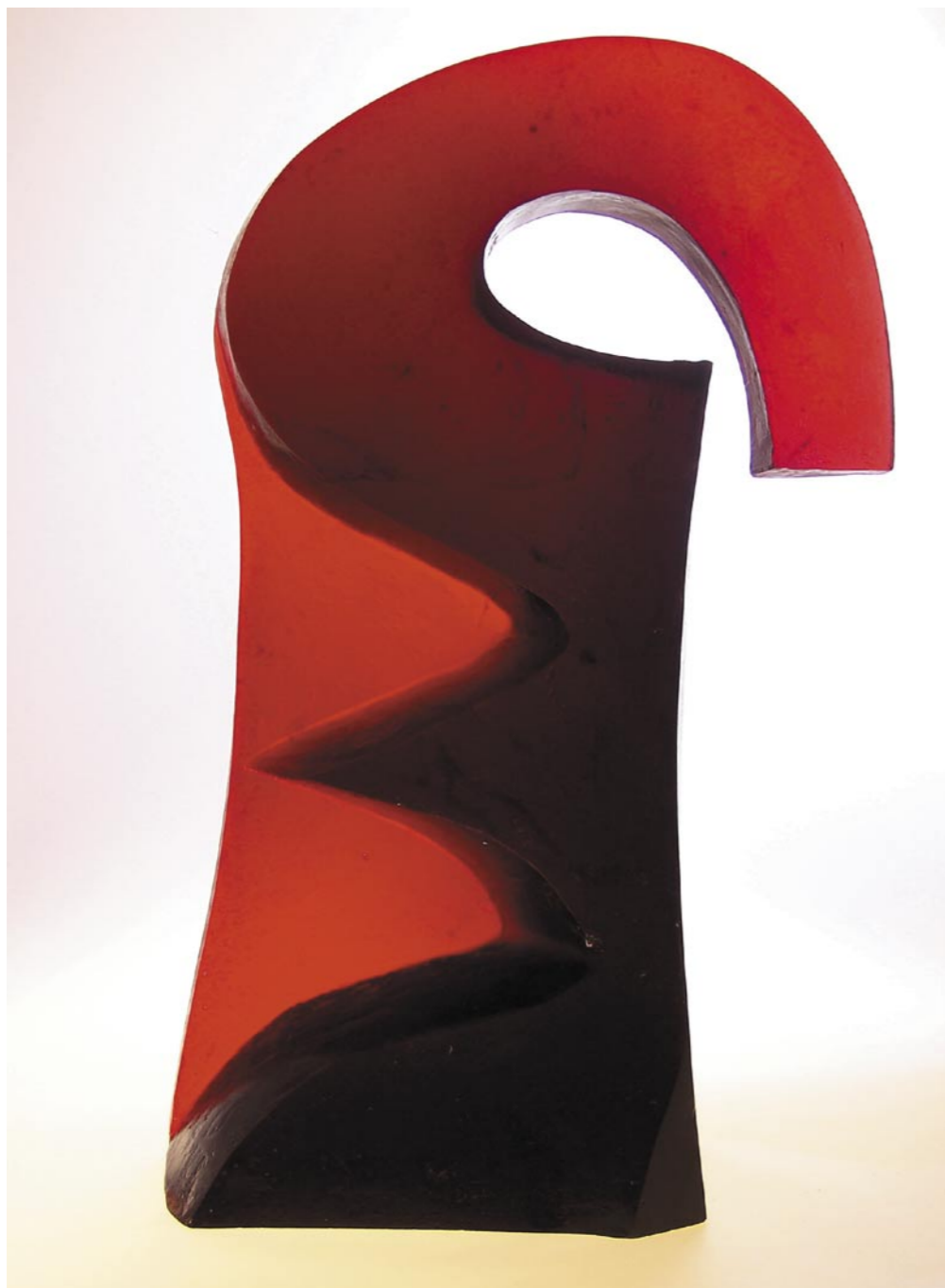
JIŘÍ KUBELKA FIGURA - FIGURE