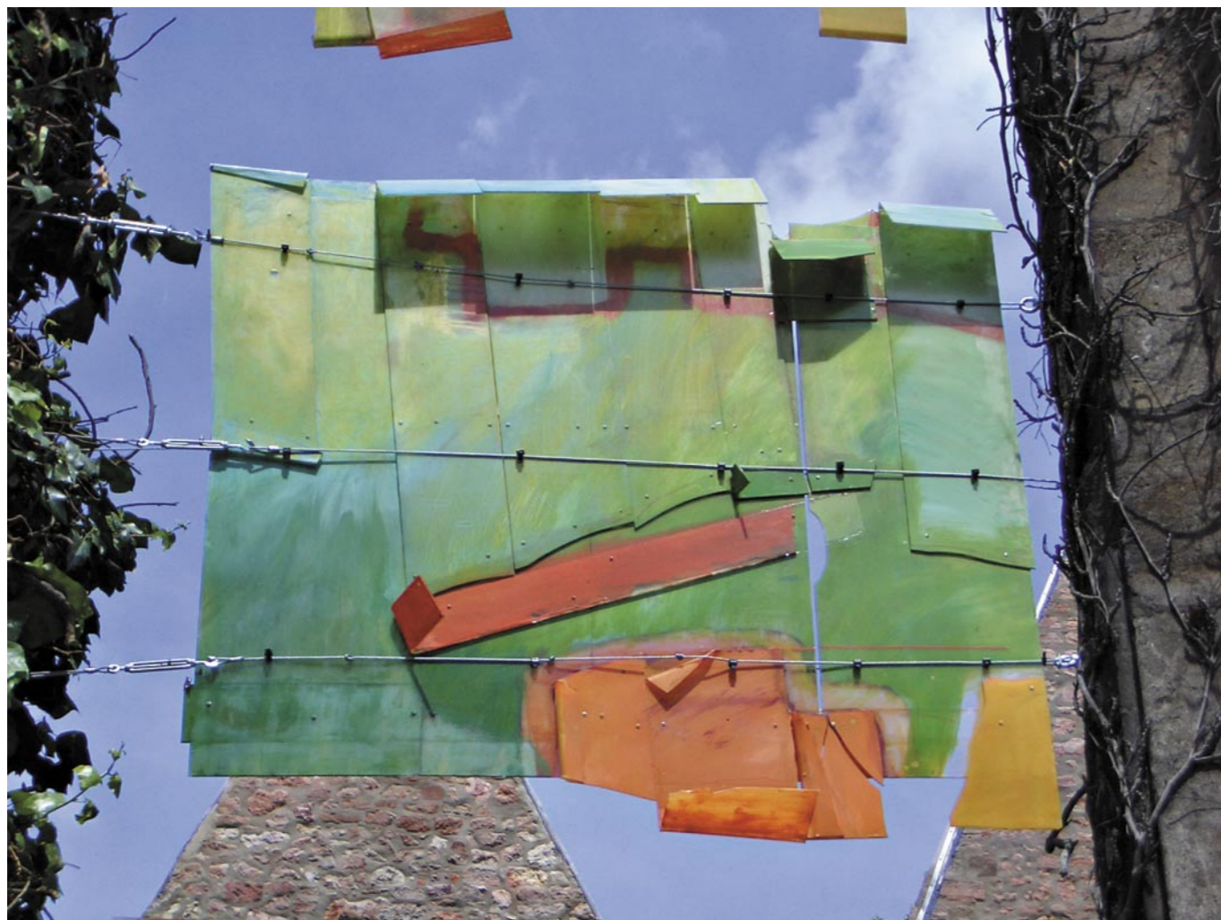
INGE - ROSE LIPPOK PICTURE BY SANDRO SIEBKE - OBRAZ PRO SANDRO SIEBKE