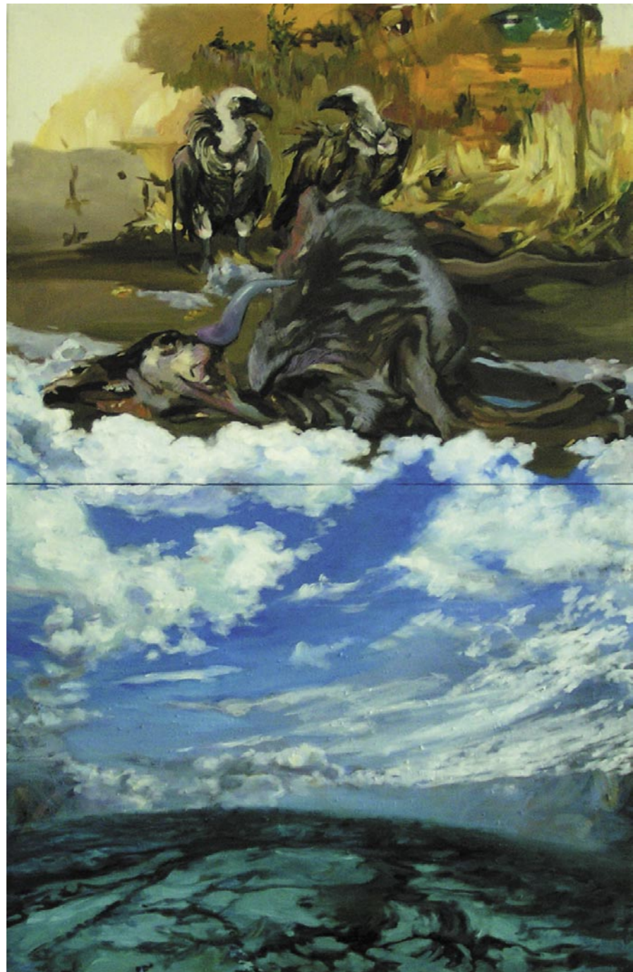
KATARINA BALÁŽOVÁ PO SMRTI - AFTER DEATH