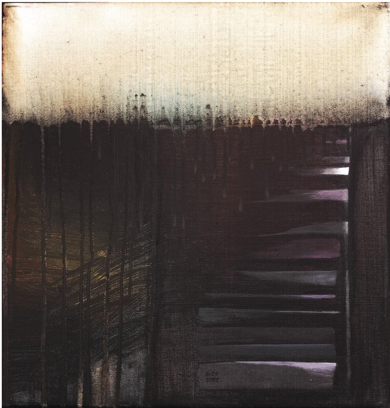
TEODOR BUZU CESTA NAHORU - WAY UP