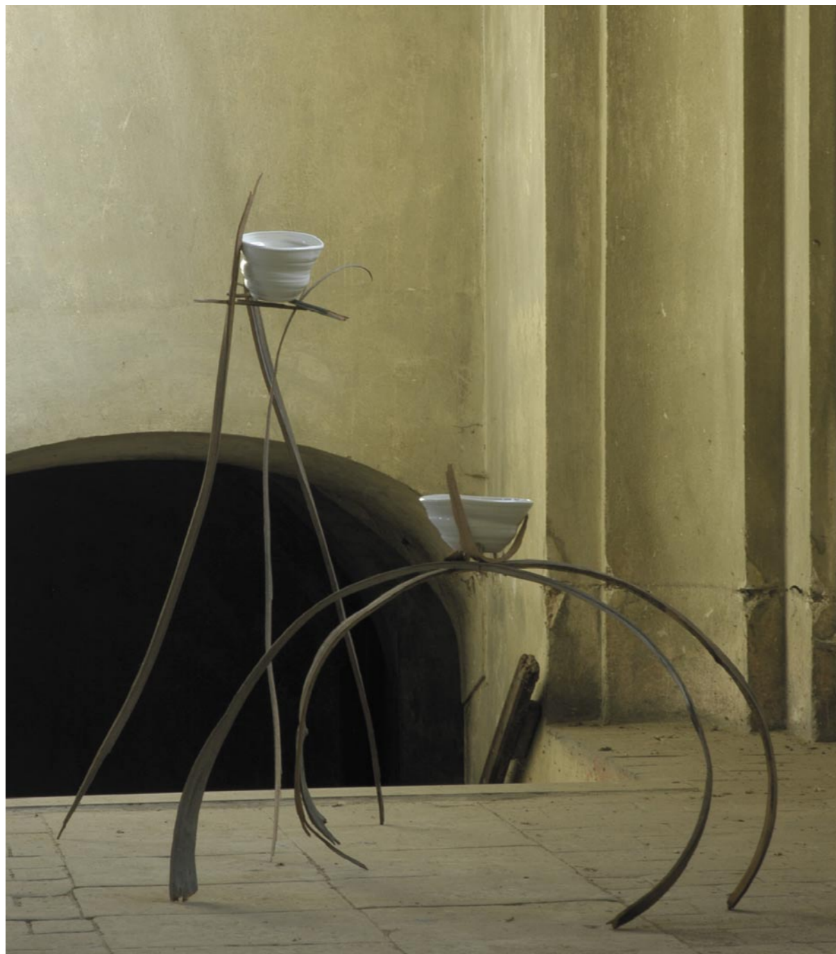
DALIBOR WORM TAO 1, TAO 2