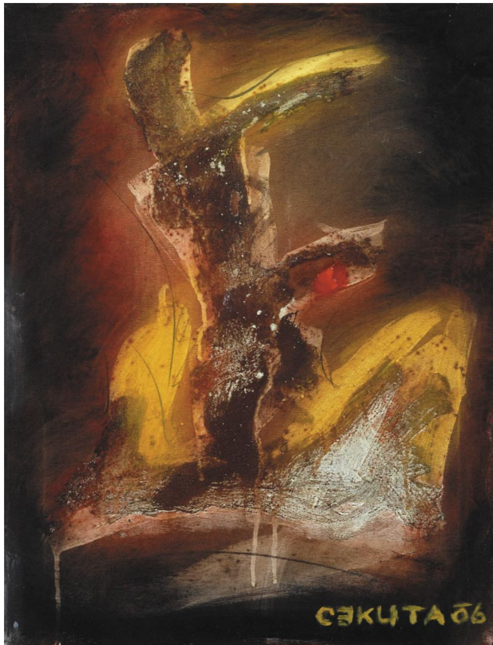
JURE CEKUTA TRASCENDENTAL COORDINATION