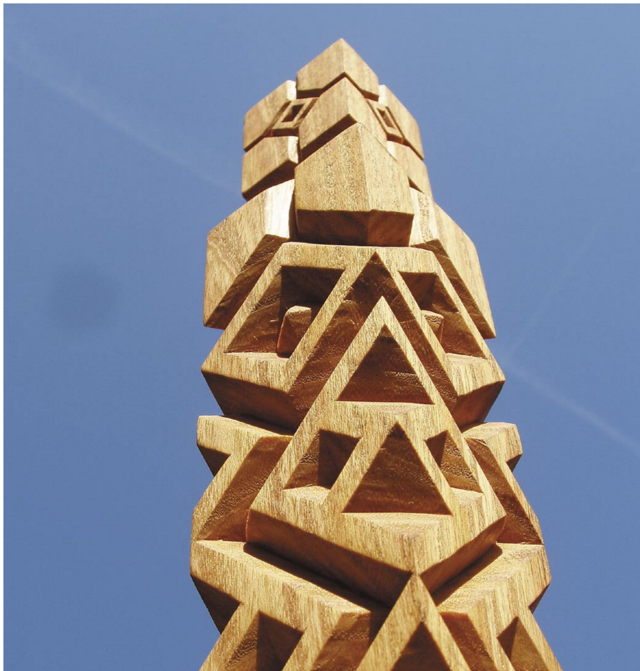
RADOMIR BUZU SLOUP NADĚJE - COLUMN OF HOPE - COLOANA SPERANȚEI