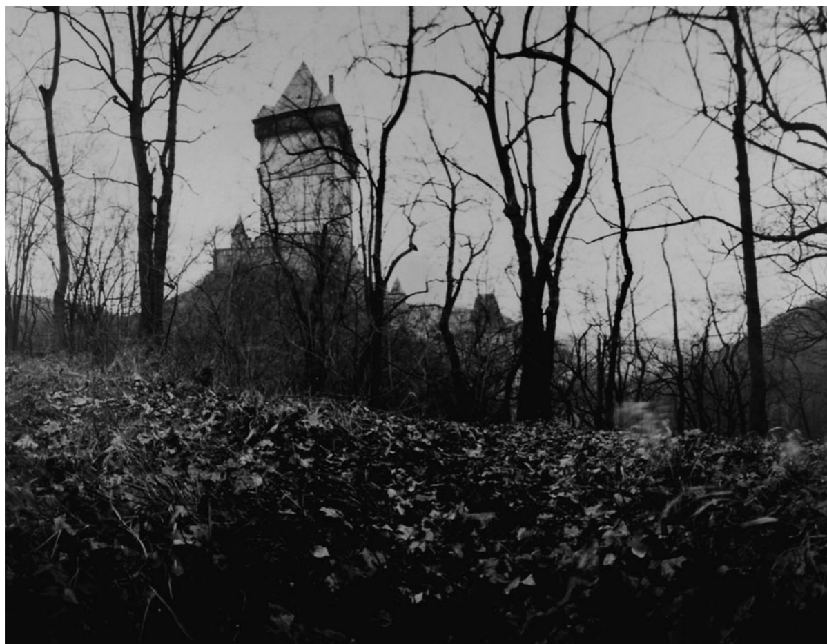
PAVEL TALICH KARLSTEJN (POZITIV)