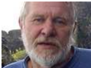
Jaromír Štětina, senátor