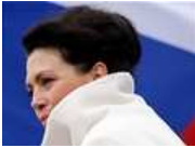
Jana Bobošíková , europoslankyně

Europoslankyně Jana Bobošíková tvrdí, že půjde o koalici její strany Politika 21 a ještě jednoho politického subjektu, který zatím nechce jmenovat. Má už sestavenou celou kandidátku, dvě místa jsou volná k obsazení pro případnou další stranu, která by chtěla s Bobošíkovou kandidovat.