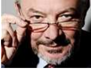
Vladimír Železný , europoslanec, předpokládaný lídr

Vladimír Železný zaregistroval počátkem roku českou stranu Libertas.cz. Nabízí ji jako platformu pro euroskeptické strany, chtěl by společnou kandidátku všech stran, které kritizují Lisabonskou smlouvu. Se Svobodnými Petra Macha vede jednání, výsledek ale zatím není znám. Pokud projekt Libertas.cz neuspěje, bude Železný kandidovat za svou stranu Nezávislí demokraté.