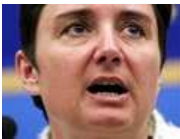
Jana Hybášková , europoslankyně

Politička, mezinárodně uznávaná odbornice na problematiku terorismu, evropské bezpečnosti, Blízkého východu a demokratizace, od roku 2004 poslankyně Evropského parlamentu, členka ELS-ED. Na podzim založila Evropskou demokratickou stranu.