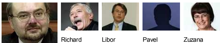
Richard Falbr, europoslanec Libor Rouček, europoslanec Pavel Poc, jednatel Zuzana Brzobohatá, poslankyně