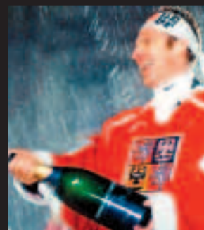
1998. Národní hrdina oslavuje naganský triumf.