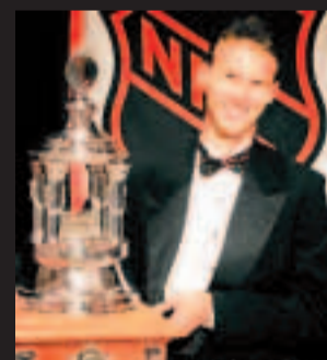
1997. Nejlepší brankář slavné NHL