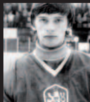
1983. Začátky v československé reprezentaci

JSEM ZPĚT! Dominik Hašek včera oznámil, že se vrátí do branky.